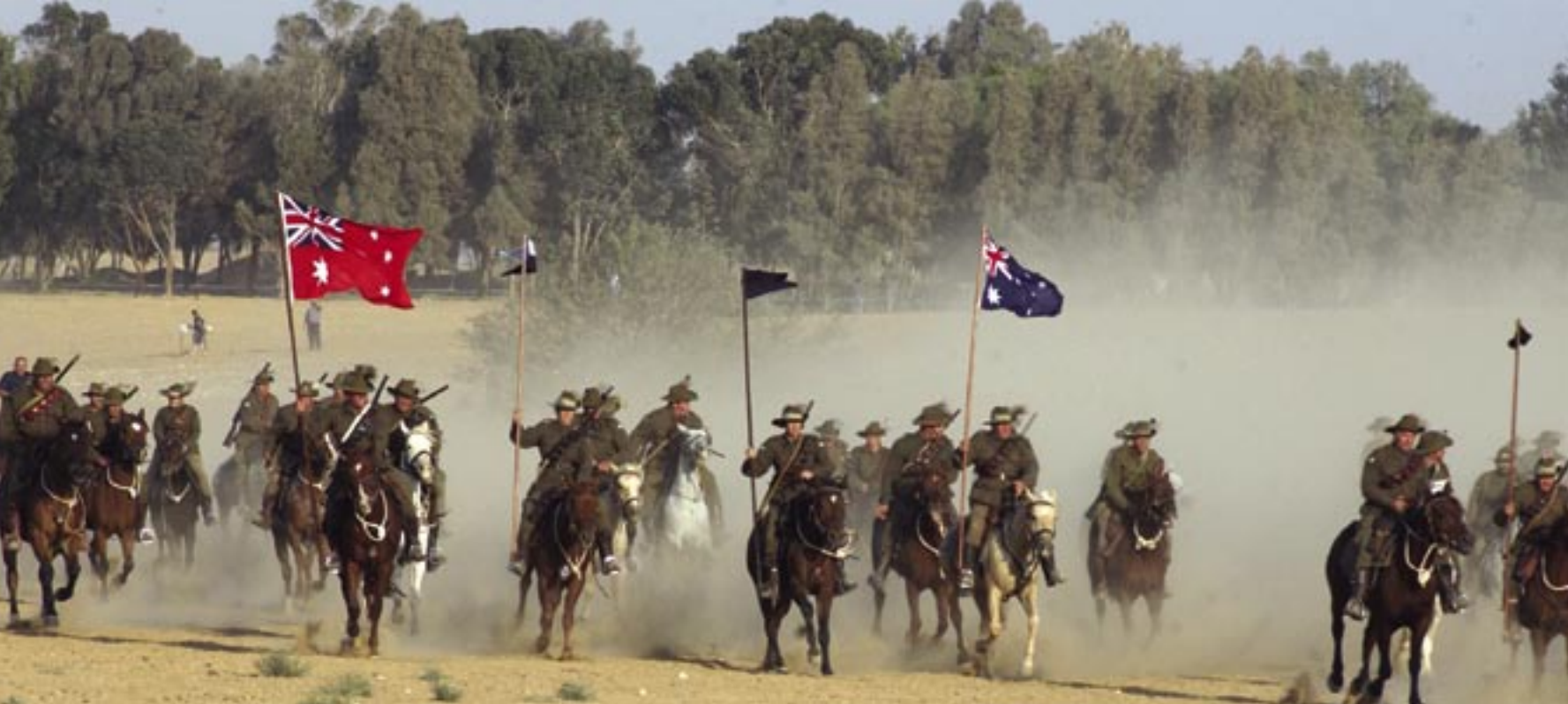
31 באוקטובר 2007. השחזור לרגל יום השנה ה-90 להסתערות גדודי הפרשים האוסטרלים הקלים ה-4 וה-12 של אוסטרליה על באר שבע. עם הרוכבים נמנו לוחמים בגילאי 18 עד 80, וביניהם צאצאי הפרשים האוסטרליים שהיו לכושים במדי צמר תקופתיים, כולל כובעים רחבי שוליים ורוכים מתקופת מלחמת העולם הראשונה.