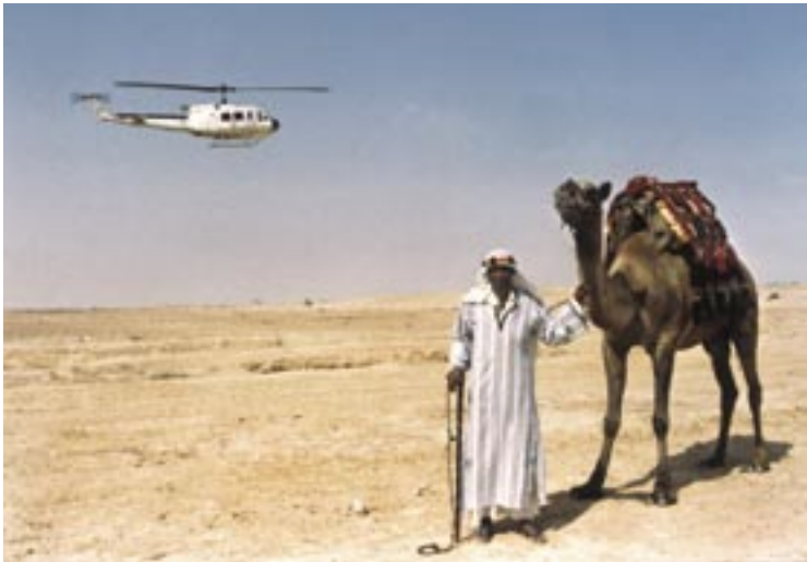
מסוק ה-Iroquois של חיל האוויר האוסטרלי במשימת סיור מעל סיני, במסגרת פעילותה של הנציגות האוסטרלית בכוח הרב לאומי והמשקיפים - סיני (MFO).

"מבצע מזורקה" מייצג את תרומתה של אוסטרליה לכוח הרב לאומי ולכוח המשקיפים - סיני (MFO) - ארגון שאינו כפוף לאו"ם, אשר הוקם בשנת 1981 לצורך פיקוח על קיום הסכם השלום שנחתם בשנת 1979 בין ישראל למצרים. אוסטרליה, שהנה תורמת מרכזית לארגון, החלה את פעילותה במסגרת הכוח בשנת 1982 עם הקמתה של טייסת מסוקים משותפת לה ולניו-זילנד. כיום משתתפות ב-MFO 11 מדינות, כולל אוסטרליה, ניו-זילנד, ארצות הברית, קנדה, פיג'י וצרפת. 25 אנשי הצבא האוסטרלים מסייעים לתהליך השלום באמצעות פיקוח על הגבול, הכנת תדרכי פעילות יומיים ותמיכה במפקדה.