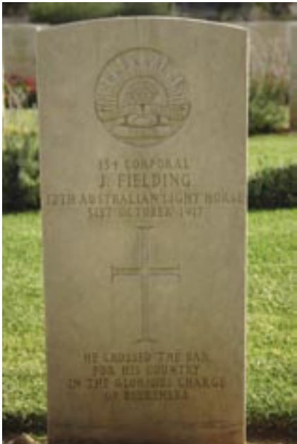
המצבה של רב"ט ג'. פילדינג, בית הקברות הצבאי הבריטי, באר שבע. במהלך כיבוש באר שבע נהרגו 31 אוסטרלים ונפצעו 36.

כיבוש באר שבע היה הצעד הקריטי הראשון לקראת סיום השלטון העות'מאני בארץ ישראל, והפעיל שרשרת אירועים אשר הגיעו לשיאם עם כינון מדינת ישראל ב-1948. ביום שבו נכבשה באר שבע אישר קבינט המלחמה הבריטי את נוסח ההצהרה שהביעה אהדה לשאיפות הציוניות, ואשר פורסמה יומיים לאחר מכן על ידי שר החוץ ארתור בלפור. תנאי ההצהרה שולבו בסופו של דבר במנדט של ליגת האומות, אשר אישר את השלטון הבריטי בארץ ישראל.