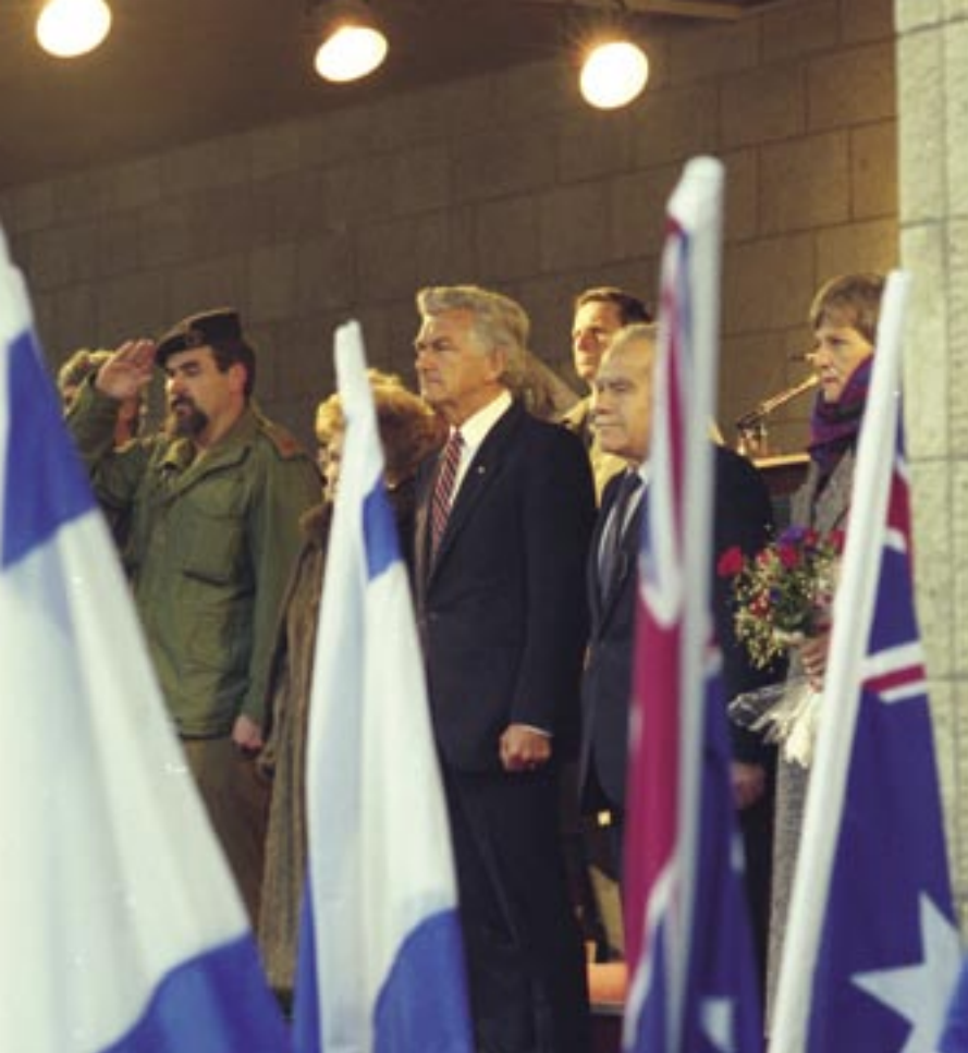
ינואר 1987. זמן קצר לאחר ביקורו באוסטרליה של הנשיא הרצוג הגיע בוב הוק למדינת ישראל והפך לראש הממשלה המכהן הראשון של אוסטרליה שביקר במדינת ישראל. ברקע נראה השגריר האוסטרלי רוברט מרילס. (NAA:A8746, KN18/2/87/154)

מתוך הוקרה לראש הממשלה הוק ולתמיכתו במדינת ישראל והעם היהודי, נטעה הקרן הקיימת לישראל יער על שמו. יער הידידות אוסטרליה-ישראל שבגליל, אשר נחנך בשנת 1988, ניטע כאות הוקרה לכל ראשי הממשלות של אוסטרליה ושל מדינת ישראל, לרגל חגיגות מאתיים השנה לאוסטרליה ויובל ה-40 למדינת ישראל.