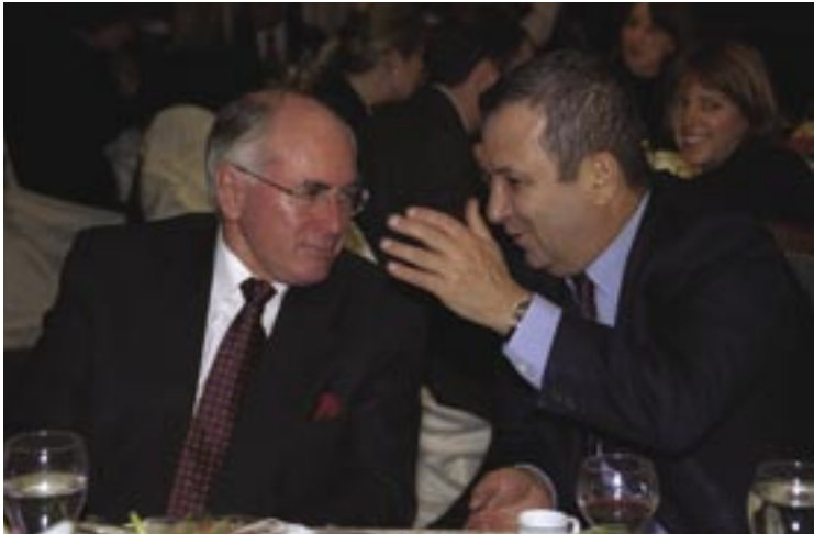
אפריל 2000. ראש ממשלת אוסטרליה ג'ון הווארד משוחח עם ראש ממשלת ישראל אהוד ברק במהלך ארוחת ערב שנערכה בירושלים, במסגרת ביקורו הרשמי של הווארד בישראל.

במסגרת מחויבותה של אוסטרליה לתהליך השלום הערבי-ישראלי, אשר החל לאחר מלחמת המפרץ של 1990/1 ולאחר ועידת מדריד, אירחה ממשלת קיטינג כינוס של מומחים מתחומים שונים אשר התמקד בסוגיית ההים. באירוע השתתפו מדענים ישראלים, פלשתינים וערבים וכן נציגי רשויות שונות.