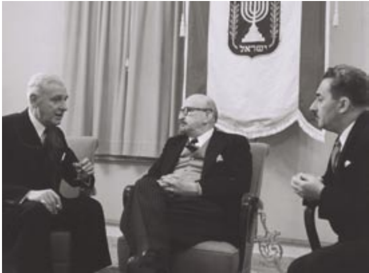
4 בינואר 1950. השגריר הראשון של אוסטרליה במדינת ישראל, צ. וו. פורמאן (משמאל), משוחח עם נשיא מדינת ישראל ד"ר חיים ויצמן (מרכז) ושר החוץ משה שרת לאחר הגשת כתב ההאמנה שלו.

כמה מן הצעדים הראשונים בקשרי הגומלין בין המדינות