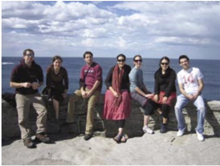
ספטמבר 2007. חברי צוות ה"סמינרים הציוניים" של סידני, בחברת עולים חדשים וחברי הקהילה היהודית של North Shore בסידני, בטיילת "Bondi to Bronte" שבסידני.

הפדרציה הציונית של אוסטרליה נוסדה במלבורן ב-1927. עם חבריה הראשונים נמנו הגנרל סיר ג'ון מונש והרב ג'. ברודי, ומאוחר יותר גם מקס פריליך, אשר עמל ללא לאות לצד ד"ר אבאט כדי לטפח את תמיכת אוסטרליה בהקמתה של מדינת ישראל. היום מהווה ה-ZFA את ארגון הגג הפדרלי של כלל הארגונים הציוניים הפועלים באוסטרליה, והוא אחראי לקשרים בין יהדות אוסטרליה לבין מדינת ישראל ולמימוש ולקידום יעדי הציונות, כמו גם להבטחת קשר בר קיימא, דינאמי ומתמשך עם מדינת ישראל. דוגמה לפעילות הארגון היא קידום פרויקט "הסמינרים הציוניים", תוכניתה של מחלקת החינוך בסוכנות היהודית, אשר הושק בבתי הספר