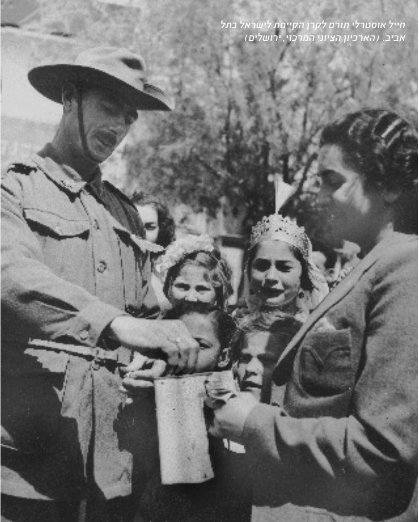
חייל אוסטרלי תורם לקרן הקיימת לישראל בתל אביב.

כפי שצוין במהדורת ה-Sydney Jewish News מן ה-21 ביוני 1940, "החיילים האוסטרליים מתקבלים בזרועות פתוחות בתל אביב. הילדים במיוחד מאושרים מן הביקור ומתענגים באופן גלוי על מעשי הקונדס של גיבוריהם. רבים מן הלוחמים תרמו לאחרונה לקרן הקיימת, לצורך הקמת חורשת זיכרון, ועל מדים רבים נראים התגים הכחולים-לבנים של הקרן הקיימת. קבוצת גברים אחת משכה אליה קהל רב ברחוב אלנבי, שם ארגנה אירוע שירה בציבור של שירי המלחמה, כולל "Washing on Siegfried Line"-1 ו-"Pack up your Troubles".