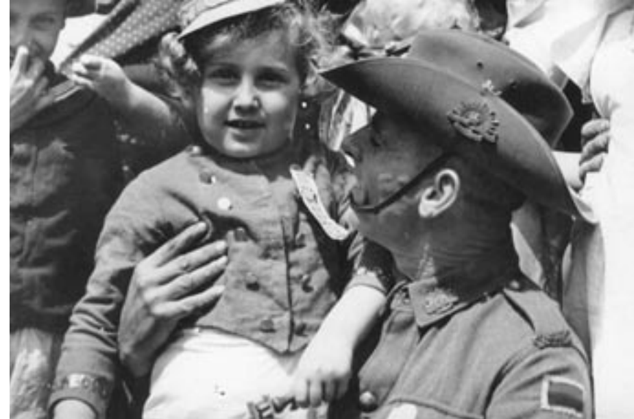
1940. חייל אוסטרלי עם נער יהודי צעיר בחגיגות פורים בתל אביב.