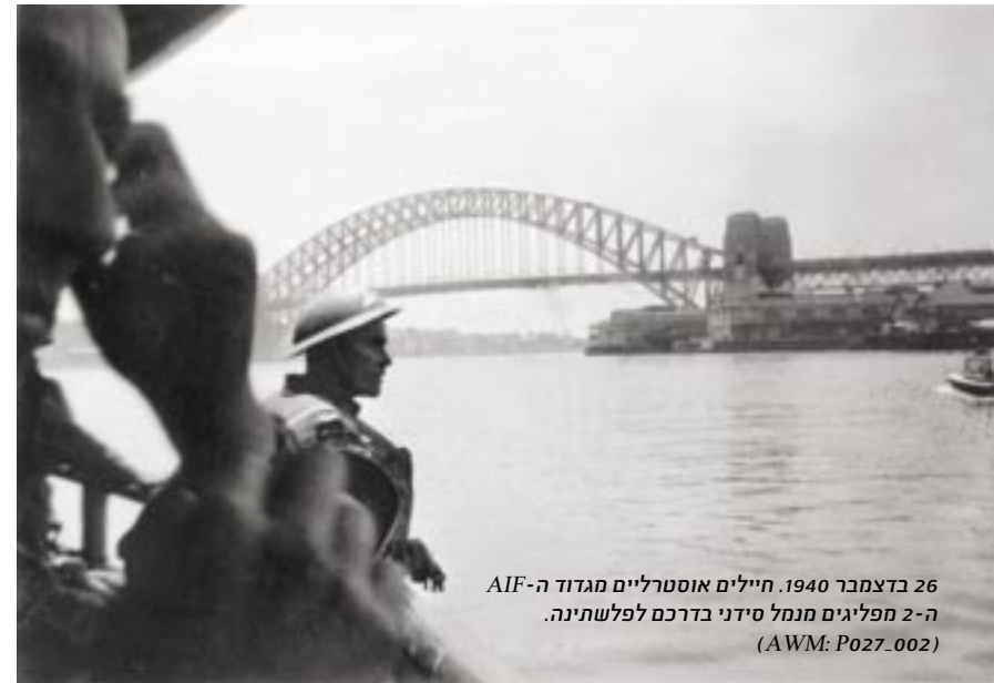
26 בדצמבר 1940. חיילים אוסטרליים מגדוד ה-AIF ה-2 מפליגים מנמל סידיני בדרכם לפלשתינה. (AWM: P027.002)

בניגוד למלחמת העולם הראשונה, במלחמת העולם השנייה לא התקיים מבצע צבאי בפלשתינה. המערכה הצבאית המשמעותית שהתקיימה במזרח התיכון בין גרמניה ואיטליה לבין בעלות הברית התחוללה בצפון אפריקה, ובה התבלטו במיוחד דיבזיות ה-AIF ה-6, ה-7 וה-9. אילו היו רומל והצבא הגרמני פורצים אל מעבר לגבול מצרים, סביר להניח שהקץ היה מקיץ על האוכלוסייה היהודית של ארץ ישראל. בנוסף, בסוריה התחולל מסע קרב צדדי בסיוע מקומי כנגד צרפת של וישי.