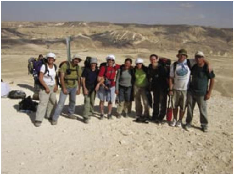
אוקטובר 2005. קבוצה של ישראלים ואוסטרלים בטיול במדבר הנגב. הקבוצה, שנפגשה במסגרת "סמינרים ציוניים" שנערכו בישראל בחסות הפדרציה הציונית של אוסטרליה, כוללת שלושה עולים חדשים מאוסטרליה ואת הישראלים שאירחו באוסטרליה כשאלה ביקרו בקהילה של סידני בין 2002-2005.