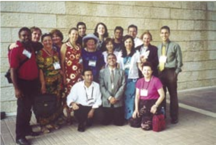
מאי 2001. משלחת בהאית מאוסטרליה משתתפת בפתיחת טראסות הגנים המלכותיים במקדש הבהאים שעל הר הכרמל בחיפה.