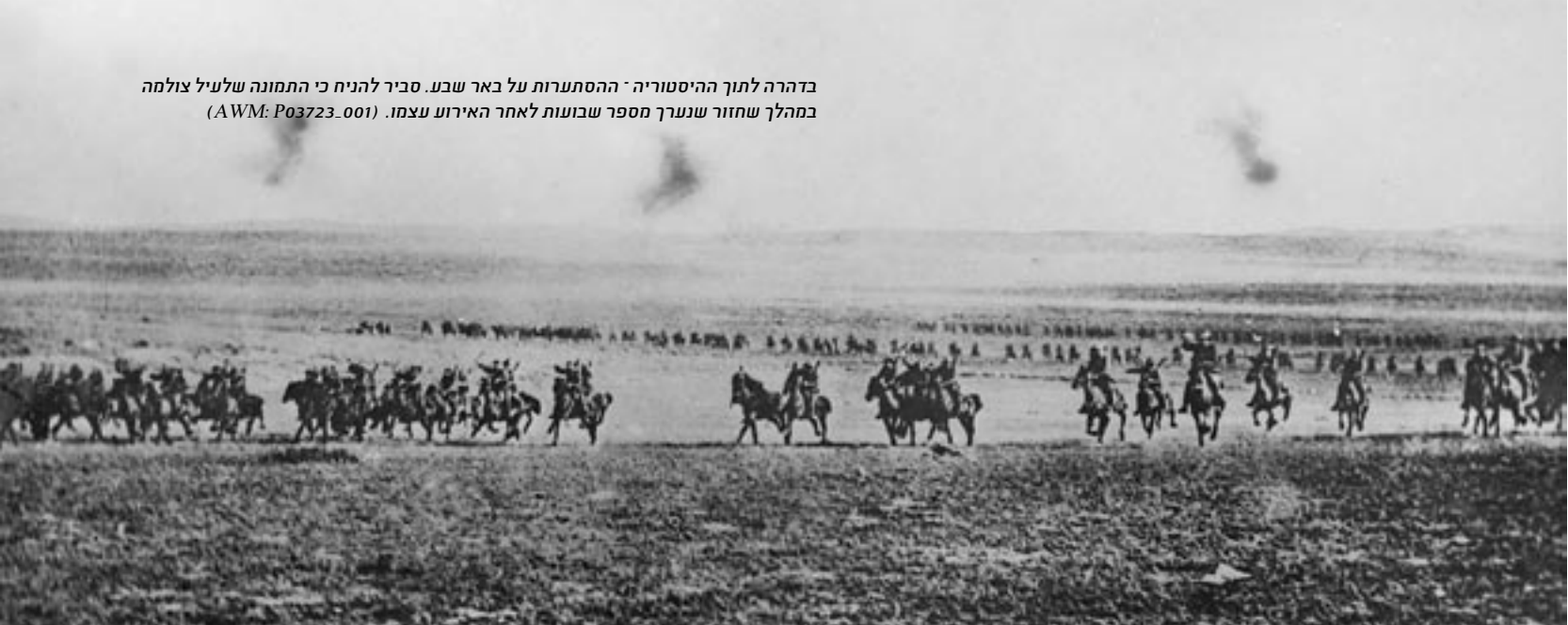
בדהרה לתוך ההיסטוריה - ההסתערות על באר שבע. סביר להניח כי התמונה שלעיל צולמה במהלך שחזור שנערך מספר שבועות לאחר האירוע עצמו.