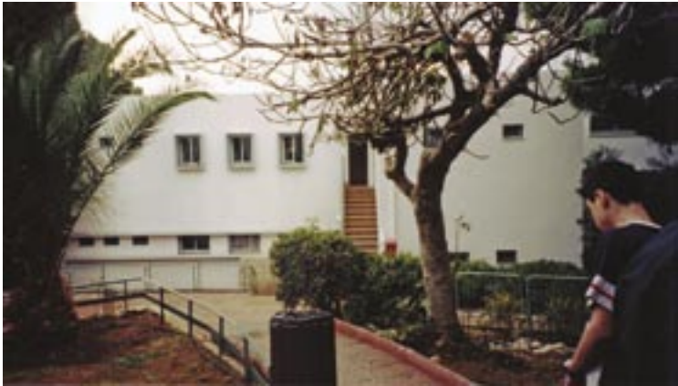
בית הספר של ויצ"ו "אחוזת ילדים" הוא פרויקט הדגל של ויצ"ו אוסטרליה במדינת ישראל. בית הספר, הממוקם על הכרמל, מאפשר לבני נוער בעייתיים להתגבר על קשייהם. נכון לעכשיו לומדים במקום 120 ילדים, בגילאים 12 עד 18, המטופלים על ידי צוות ייחודי של פסיכולוגים, אנשי חינוך ומורים, וזאת במסגרת תוכנית שכוללת סכמה חדשנית של "אמץ חית מחמד" ותמיכה של אנשי בסיס חיל הים הקרוב.

ההסתדרות העולמית של נשים ציוניות (ויצ"ו) היא תנועה בינלאומית על-מפלגתית המוקדשת לקידום מעמד הנשים, לרווחת כל מגזריה של החברה הישראלית ולקידום החינוך היהודי במדינת ישראל ובגולה. מאז הקמתו בשנת 1928, צמח הארגון וכיום הוא פעיל ב-50 פדרציות בכל רחבי העולם ונהנה ממעמד מייעץ כארגון לא ממשלתי ליד ECOSOC ויוניצ"ף בארצות הברית. ויצ"ו אוסטרליה נוסד בשנת 1934 וכיום תומך ומקיים מספר פרויקטים, כגון: בית הספר ויצ"ו- אחוזת ילדים בחיפה, מעונות יום בתל אביב וברעננה, מועדון הנוער קורסונסקי בכפר סבא, מעונות יום בבסיס חיל האוויר חצור ומועדון הנשים ע"ש איה דינשטיין בירושלים. בנאומה במסגרת הכינוס התלת-שנתי ה-21 של ויצ"ו אוסטרליה הצהירה הלנה גלזר, נשיאת ויצ"ו העולמית: "במהלך השנים הפגין ויצ"ו אוסטרליה אהבה גדולה, חום, מסירות ומחויבות כלפי מדינת ישראל והחברה שבה, אשר באו לידי ביטוי ב-16 הפרויקטים שלהם נתן את חסותו בישראל, תוך שימור התרבות היהודית והמסורת בקהילות המקומיות. יהא אשר יהא המצב בישראל, תמיד נוכל לסמוך על החברות האוסטרליות שלנו".