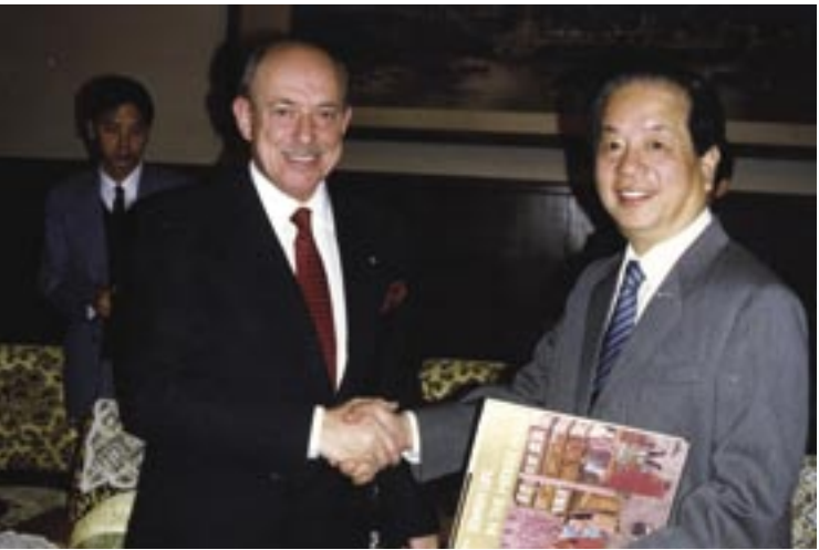
אוקטובר 1991. המנהיג היהודי-אוסטרלי, איזי לייבלר, עם שר החוץ הסיני קוויאן קי'צ'ן בבייג'ינג לאחר הענקת ספר אודות תולדות העם היהודי. התמונה צולמה זמן קצר לפני ההכרה הרשמית של סין במדינת ישראל, בפברואר 1992.

בשנת 1955 הביעו ראש ממשלת אוסטרליה רוברט מנויס ושר החוץ שלה ריצ'רד קייסי את תמיכתם הרשמית בתוכנית השלום הערבית-ישראלית שהוצעה על ידי שר החוץ האמריקני ג'ון פוסטר דאלס. שתי נקודות המפתח של התוכנית היו כדלהלן: גיבוש הסכם רשמי כדי למנוע כל ניסיון של אחד הצדדים לשנות בכוח את הגבולות בין ישראל לבין שכנותיה הערביות; וכן הלוואה בינלאומית שתאפשר למדינת ישראל לפצות את הפליטים הערבים מפלשתינה שלפני הקמת המדינה.