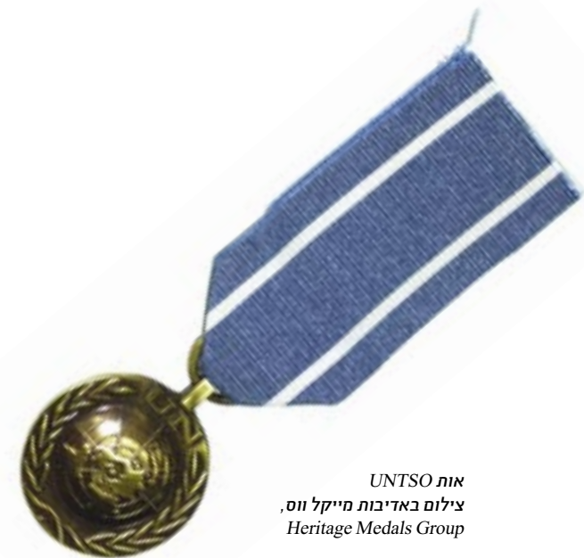
אות UNTSO

ארגון UNTSO הוקם בשנת 1948, לאחר שמועצת הביטחון של האו"ם קיבלה החלטה שקראה להפסקת פעולות האיבה בגבולותיה של פלשתינה והורתה למתווך מטעם האו"ם לפקח על שמירתה של הפסקת האש בסיוע קבוצה של פקחים צבאיים. כוח משימה זה של משקיפים בלתי חמושים זכה לכינוי UNTSO (ארגון הפיקוח על שביתת הנשק של האו"ם), ולמעשה היה כוח שמירת השלום הראשון שהוקם על ידי האומות המאוחדות. כיום מונה UNTSO כ-150 משקיפים צבאיים ונתמך על ידי צוות אזרחי, מקומי ובינלאומי כאחד. מפקדת UNTSO נמצאת בירושלים, במקום ששימש כמשכנו של הנציב הבריטי בארץ ישראל. לארגון מוצבים גם בנקורה שבדרום לבנון, בטבריה, בדמשק שבסוריה ובאיסמעיליה שבמצרים. "מבצע פלאדין" - תרומתה של אוסטרליה ל-UNTSO - החל ב-1956, עם הקצאתם של ארבעה משקיפים מטעמה למשימה. כיום מועסקים ב-UNTSO שנים עשר עובדים אוסטרליים המשמשים כמשקיפים או קציני מטה.