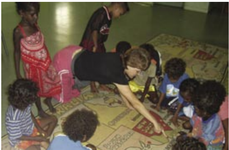
מורה של פרויקט "יחד" מלמד ילדים מקהילת הילידים Aurukun, North Queensland.