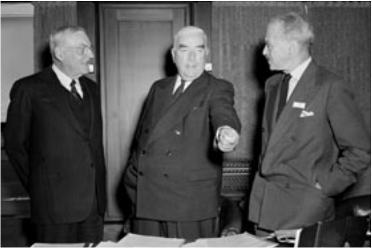
מרץ 1957. שר החוץ האמריקני ג'ון פוסטר דאלס (משמאל), ראש ממשלת אוסטרליה רוברט מנויס (מרכז) ושר החוץ מר ריצ'רד ג'. קייסי (מימין) נפגשים בבית הנבחרים בקנברה לאחר משבר סואץ של שנת 1956.

מאז 1949 נקטו כל ממשלות אוסטרליה, מכל גוני הקשת הפוליטית, באותה מדיניות רשמית כלפי קשרי אוסטרליה-ישראל, שעקרונותיה הותוו על ידי ד"ר אבאט בתקופת המפתח שבין 1947 לבין 1949. אוסטרליה מחויבת לפתרון של שתי מדינות לסכסוך הישראלי-פלשתינאי, וזאת על סמך זכותה של מדינת ישראל להתקיים בשלום ובביטחון ועל סמך שאיפתו החוקית של העם הפלשתיני למדינה משלו. אוסטרליה תומכת בעקביות בכל הניסיונות הבינלאומיים להגיע לפשרה הוגנת בנוגע לקונפליקט הישראלי-פלשתיני ובנוגע לסכסוך הערבי-ישראלי בכלל.