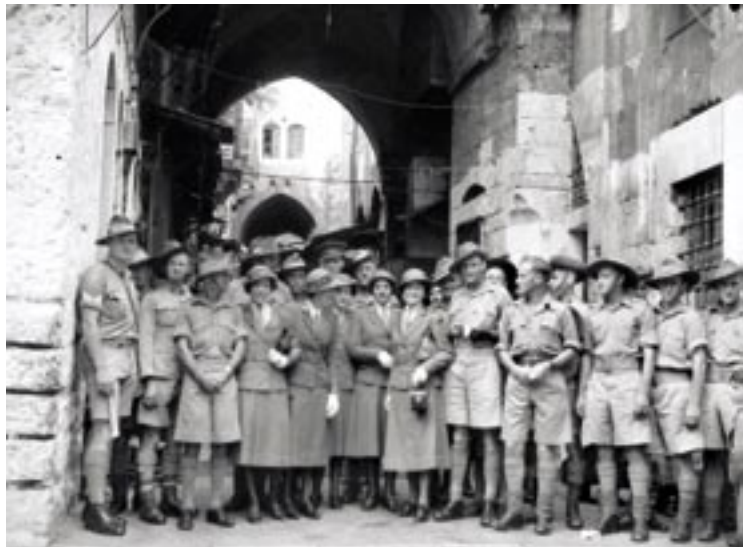
6 ביוני 1940. חיילים אוסטרליים השוהים בחופשה בירושלים נפגשים עם קבוצה של נשים אוסטרליות שמשרות בפלשתינה במסגרת הצבא הבריטי. נשים אלה, והכוחות הבריטיים שאליהם הן מסופחות, שירתו בזירת הקרבות בצרפת עד זמן לא רב קודם לכן.

במהלך מלחמת העולם השנייה הקים היישוב העברי ״ועדות הכנסת אורחים״ בערים תל אביב, ירושלים וחיפה, שנועדו לספק אפשרויות בידור וספורט, חדרי קריאה, שירותי מתורגמנות, ארוחות חמות ולינה לאנשי הצבא האוסטרליים. ועדות אלה אף ארגנו מסיבות ריקודים שבועיות, משחקי קלפים וסיורים. כל המתקנים והשירותים שהוצעו על ידן היו פופולאריים ביותר בקרב האוסטרליים, אשר מצדם גמלו בארגון ערבי שירה קהילתיים, חגיגות בחופים ואירועים נוספים.