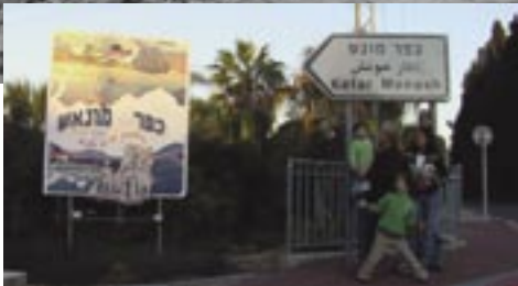
פברואר 1952. העולים החדשים לז'וג'ני שוב ממערב אוסטרליה מצטרפים לכפר מונש, מושב במרכז מדינת ישראל אשר נוסד בשנת 1946 על ידי ותיקי מלחמת העולם השנייה.

המושב, שנקרא על שם סיר ג'ון מונש, המצביא הגדול של אוסטרליה בתקופת מלחמת העולם הראשונה ואחד ממייסדי הפדרציה הציונית של אוסטרליה, יועד לקדם את הקשרים שנוצרו בין ארץ ישראל לבין האנז'קים במהלך שתי המלחמות, ולתת ביטוי מוחשי לקשרי הידידות בין העם היהודי לבין אוסטרליה.