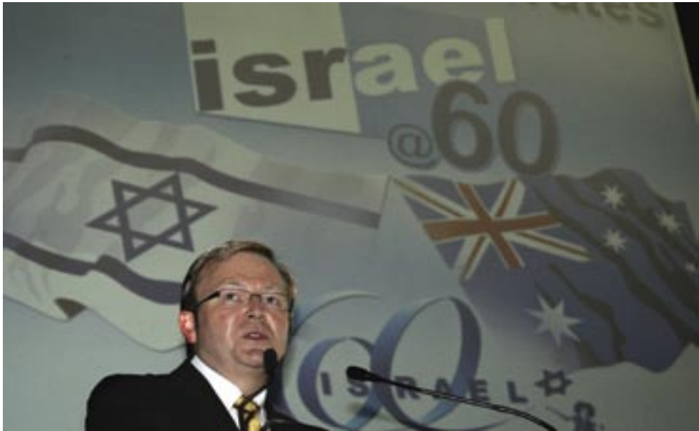
מרץ 2008. ראש ממשלת אוסטרליה, מר קווין ראד, מברך את ישראל לרגל 60 שנות המדינה.

כשקיבלה את פניו של דאונר במהלך ביקורו בשנת 2007, ציינה שרת החוץ ציפי לבני כי "מדינת ישראל ואוסטרליה אמנם מרוחקות גיאוגרפית, אולם הידידות העמוקה בין ארצותינו מתבססת על ערכים משותפים, כמו גם על אינטרסים משותפים, והנה חזקה יותר מכל מרחק... ברצוני לנצל הזדמנות זו כדי להביע את הערכתנו לממשלת אוסטרליה ולמר דאונר באופן אישי, על המאמצים שעשו כדי להעמיק ולחזק את קשרי הגומלין בינינו וכדי לתמוך ברעיון השלום באזור".