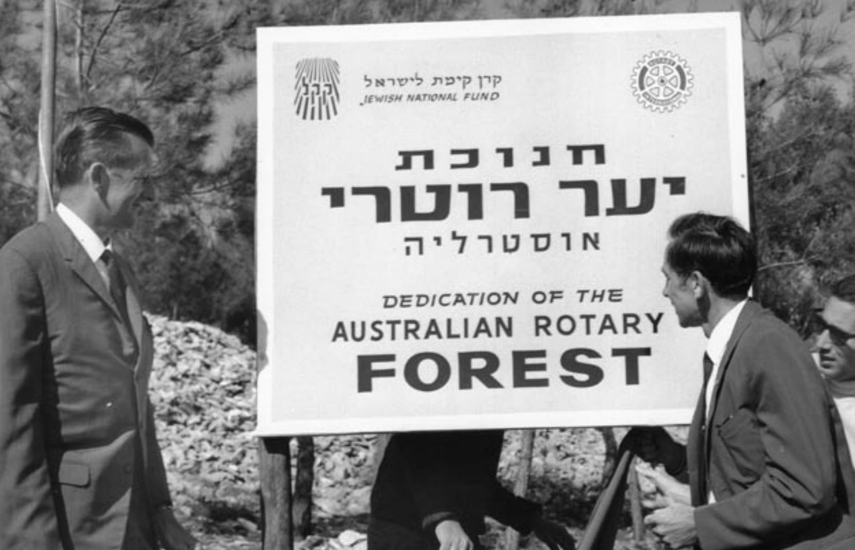
אפריל 1968. חברי קרן קיימת לישראל (אוסטרליה) ורוטרי אוסטרליה בחנוכת פרויקט ייעור מחדש שנערך במדינת ישראל בחסות שני הארגונים.

קרן היסוד (המגבית המאוחדת לישראל - UIA) הוקמה בשנת 1920 בקונגרס הציוני העולמי שנערך בלונדון. קהילות יהודיות ברחבי העולם, ובהן אוסטרליה, פתחו במסעות גיוס כספים בחסות קרן היסוד, במטרה לסייע לקהילה היהודית בארץ ישראל. היום מהווה קרן היסוד את הארגון המרכזי הפועל לגיוס כספים למען מדינת ישראל בכל רחבי העולם (להוציא ארצות הברית). הארגון, שבסיסו