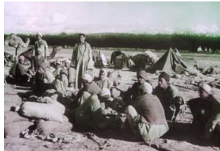
ערבים מקומיים שסופחו לפרשים הקלים האוסטרליים משוחחים במהלך ערבוב מזון לבעלי החיים.