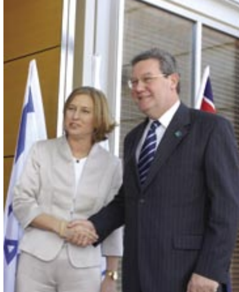
יוני 2007. שר החוץ האוסטרלי דאז, אלכסנדר דאונר, נפגש עם שרת החוץ של מדינת ישראל ציפי לבני. השר דאונר ביקר במדינת ישראל באמצע שנת 1998 וגם בינואר 2005.

בהמשיכו את מסורת התמיכה הדו-מפלגתית במדינת ישראל, הכריז השר דאונר לאחר בחירתה של ממשלת הווארד בשנת 1996: