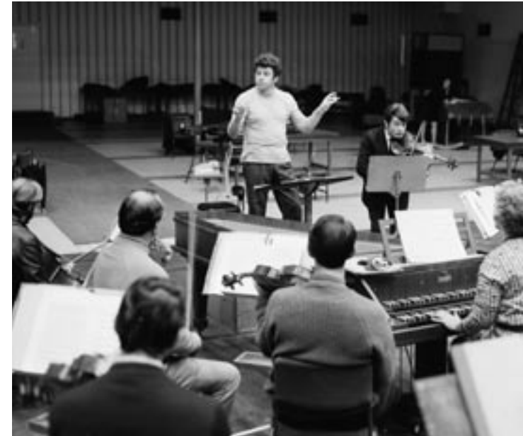
1971. המנצח הישראלי משה עצמון, שכיחן כמנצח הראשי של התזמורת הסימפונית של סידני בין השנים 1967 עד 1971 " תקופה של הצלחה גדולה עבור הארגון.

עמותת חילופי התרבות אוסטרליה ישראל (AICE), שנוסדה על ידי אלברט דדון, הושקה בהצהרה משותפת של השר דאונר ושר החוץ הישראלי בנימין נתניהו ב-2 בדצמבר 2002, במטרה לקדם את ההבנה בין אוסטרליה לבין ישראל דרך חילופי פרויקטים בתחומי הקולנוע, האמנות, הספרות ומדיה תרבותית אחרת. ה-AICE - שאירועי הדגל שלה הם פסטיבל הסרטים האוסטרליים השנתי שנערך בישראל ופסטיבל הסרטים הישראלי שנערך באוסטרליה - תמכה במגוון פרויקטים של חילופי תרבות כגון השתתפות להקת המחול בת שבע בפסטיבל סידני ב-2007 וכן התערוכה "מיתולוגיה ומציאות: אמנות מדבר אבוריג'ינית עכשווית מאוסטרליה, מאוסף גביאל פיצ'י", שנערכה בישראל ב-2003.