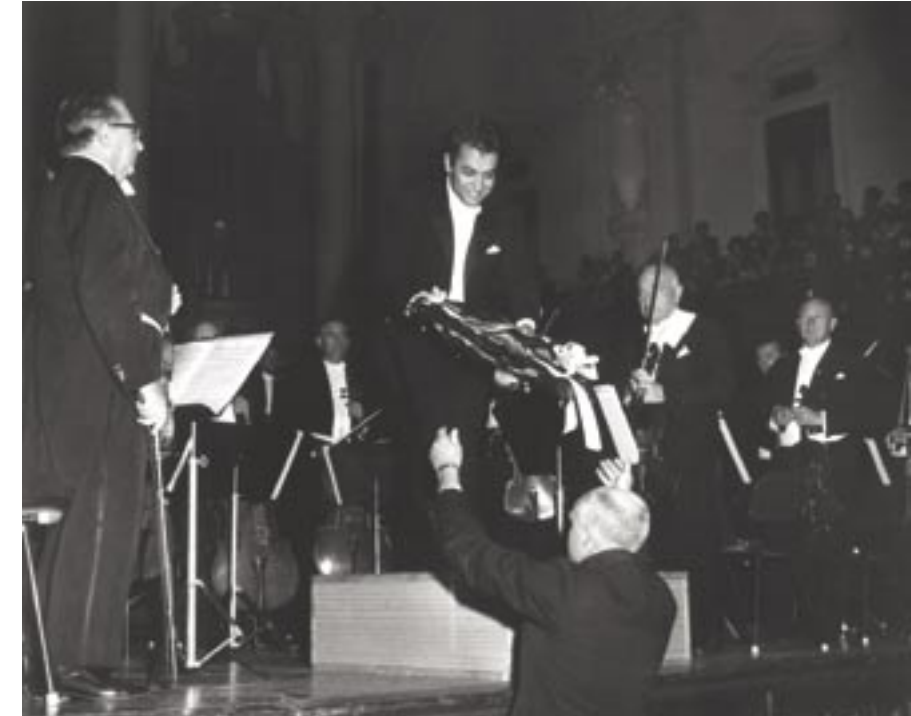
אוגוסט 1966. הקונצרט הראשון של התזמורת הפילהרמונית שנערך בסידני, בניצוחו של מאסטר זובין מהטה (מרכז).

טקסט נלווה לתמונה: תזמורת פלשתינה, שנוסדה בשנת 1936, החליפה את שמה ל"תזמורת הפילהרמונית הישראלית" לאחר הקמת מדינת ישראל במאי 1948 ונגינת "התקווה" בטקס הרשמי של הכרזת העצמאות, שנערך ב-14 במאי 1948. ארגון ידידי התזמורת האוסטרלי נוסד בשנות ה-60 על ידי רובי ריץ'-שליט, שהייתה בצעירותה פסנתרנית מוכשרת וגם אחת הפמיניסטיות הראשונות של אוסטרליה, ובשנות ה-30 אף מונתה לנשיאה האוסטרלית הראשונה של ויצ"ו. התזמורת הפילהרמונית ערכה את ביקורה הראשון באוסטרליה בשנת 1966, ואת ביקורה האחרון עד כה - בשנת 2008, לרגל חגיגות 60 השנה למדינת ישראל.