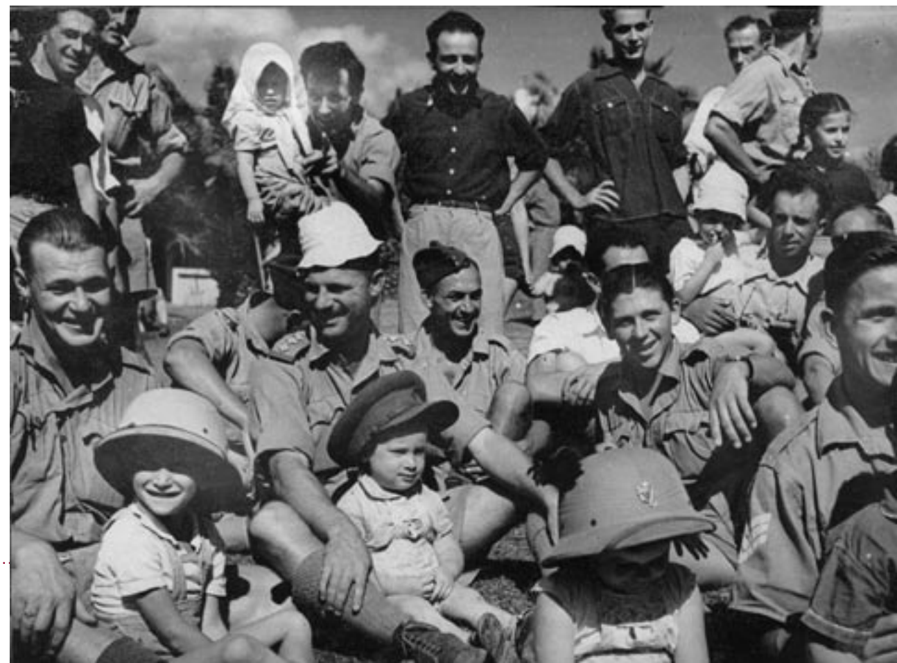
חיילים אוסטרליים עם ילדים מקיבוץ תל יוסף.

ב-8 ביוני 1941 פלשו כוחות בריטיים וכוחות בעלות הברית לסוריה ולבנון, שנשלטו על ידי צרפת של וישי. את יחידות החלוץ הובילו גששים יהודיים שגויסו בפלשתינה. במסגרת ההכנות לקראת הפלישה הוביל משה דיין קבוצה של "מדריכים וחיילי הנדסה" יהודיים מקיבוץ חניתה לעומק הלבנון, כדי שיוכלו לספק מפות של השטח לכוחות הברית. אחד מחבריו נזכר כי במהלך גיוס הכוח הציע לו דיין "אתה רוצה לראות איך האוסטרלים נלחמים?". ביום שלפני הפלישה הצטרפו דיין והכוח שלו לקבוצה של אוסטרלים בניסיון להשתלט על שני גשרים אסטרטגיים בכביש החוף, כ-10 ק"מ צפונית לגבול לבנון-פלשתינה. במטרה להגן על המיקום שלה ניסתה הקבוצה להשתלט על תחנת משטרה סמוכה, שהייתה מעוז של כוחות וישי. במהלך הקרב פגע כדור במשקפת שדרכה צפה דיין וגרם לריסוק העדשה ומארז המתכת, שנתקעו בעינו השמאלית והסבו לה נזק בלתי הפיך. לאחר המלחמה ובהמלצת אחד הקצינים האוסטרליים הוענק לדיין ה-Distinguished Service Order, אחד מהאותות הצבאיים הגבוהים ביותר של חבר העמים הבריטי, אשר ניתן לקצינים זוטרים רק בנסיבות יוצאות דופן.