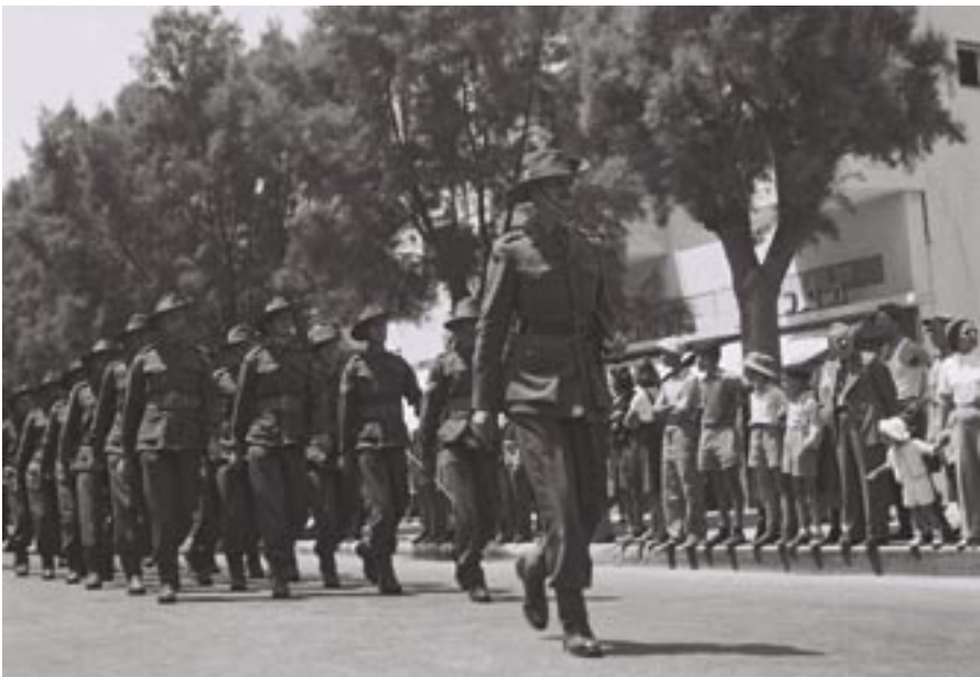
10 ביולי, 1940. העיר תל אביב חוגגת את "Aussie Day". ההמונים מציפים את רחוב בן יהודה כדי לחזות במצעד החיילים האוסטרליים.