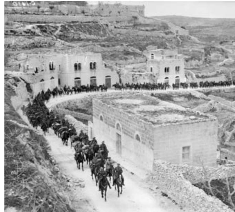
אחד מגדודי הפרשים הקלים במצעד שנערך בירושלים לאחר כיבוש העיר ב-9 בדצמבר 1917. ברקע, העל הגבעה שמשמאל, ניתן להבחין בחומות העיר העתיקה.