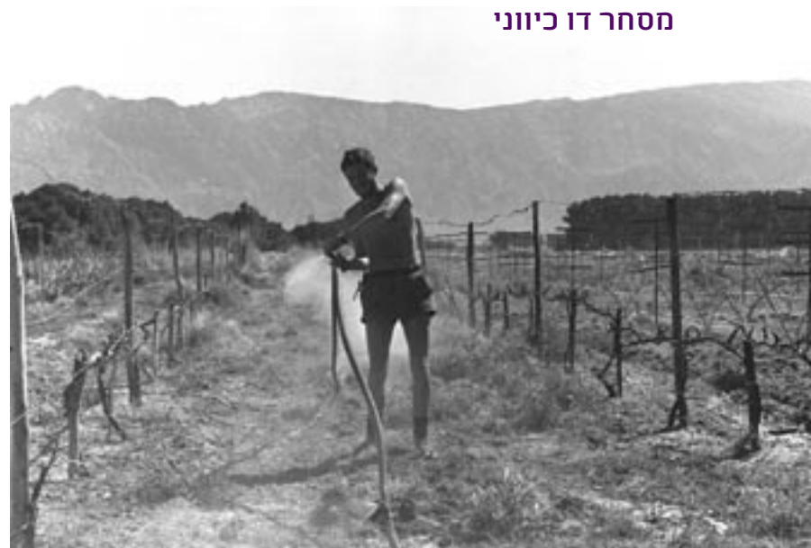
פברואר 1969. מתנדב מאוסטרליה משקה את הכרם בקיבוץ יוטבתה שבערבה, דרום מדינת ישראל. החדשנות שאפיינה את תנועת הקיבוצים בראשיתה השתלמה בטווח הארוך, בכך שאפשרה לישראל להפוך ליצואנית מובילה של טכנולוגיות וידע חקלאיים.