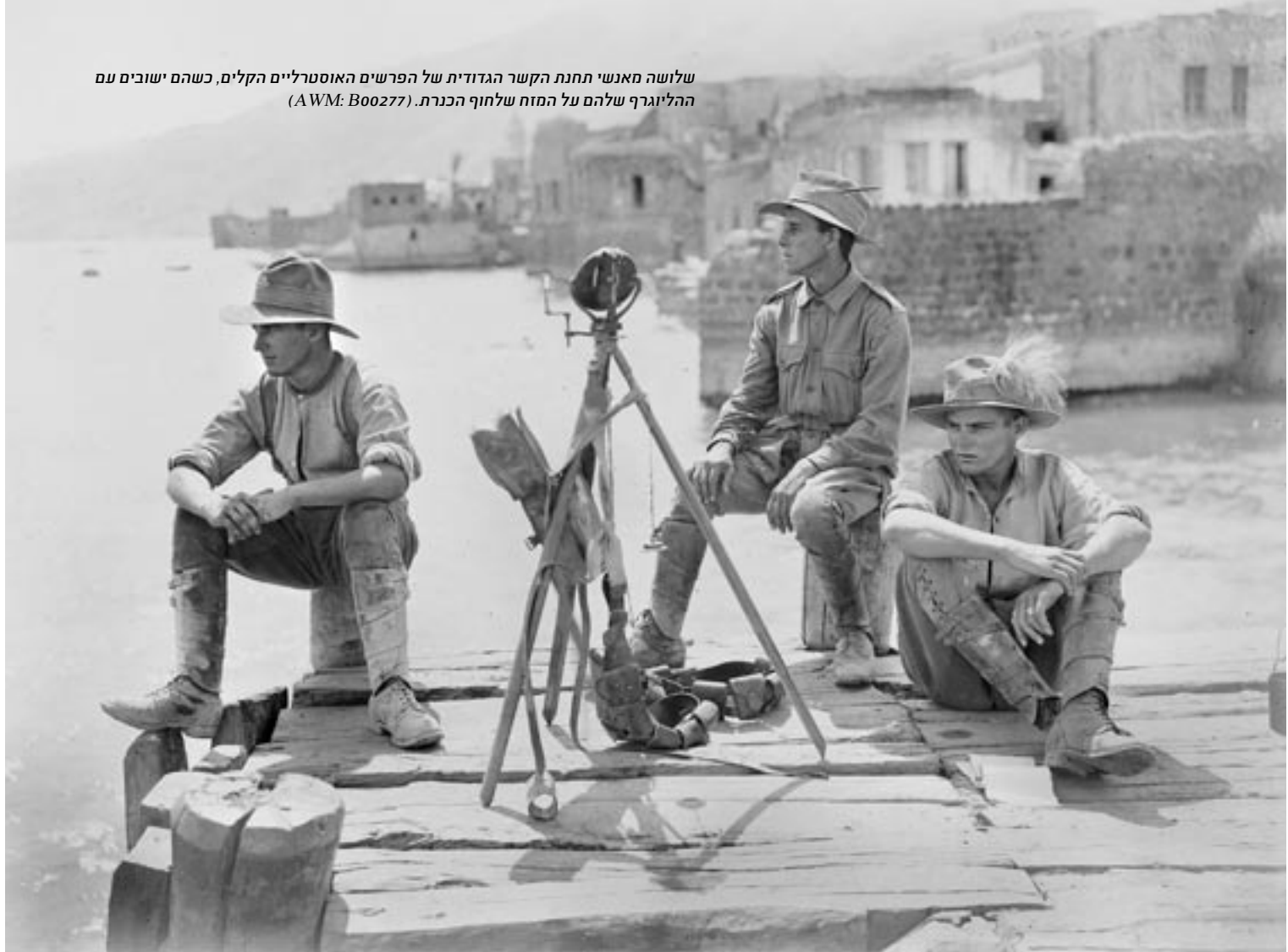
שלושה מאנשי תחנת הקשר הגדודית של הפרשים האוסטרליים הקלים, כשהם ישובים עם ההליוגרף שלהם על המזח שלחוף הכנרת.

ב-25 בספטמבר 1918 הסתער גדוד הפרשים הקלים האוסטרלים ה-11 של הבריגדה הקלה ה-4, בסגנון כיבוש באר שבע, על חפירות הטורקים ועל המקלענים הגרמנים שהתרכזו בצמח שבקצה הדרומי של הכנרת, ליד טבריה. האוסטרלים ירדו מסוסיהם ונכנסו לקרב פנים אל פנים מול הטורקים. פלוגה מגדוד הפרשים הקלים האוסטרלים ה-12 התקדמה לעבר טבריה מדרום מערב, לאורך שפת האגם. הבריגדה ה-3 הקלה איגפה את טבריה מדרום מערב. לאחר כיבוש צמח הם התקדמו לעבר טבריה מן הצפון. שני הכוחות השתלטו על טבריה שלחוף הכנרת בשעות אחר הצהריים המאוחרות. תושבי העיר קידמו את פניהם בהתלהבות אדירה.