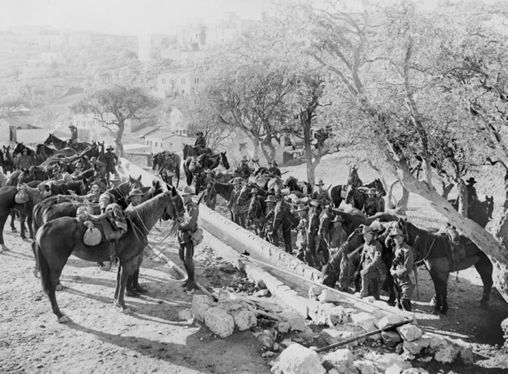
אוסטרלים מן הדיביזיה הרכובה של האנו"ק משקים את סוסיהם לרגלי הר ציון.