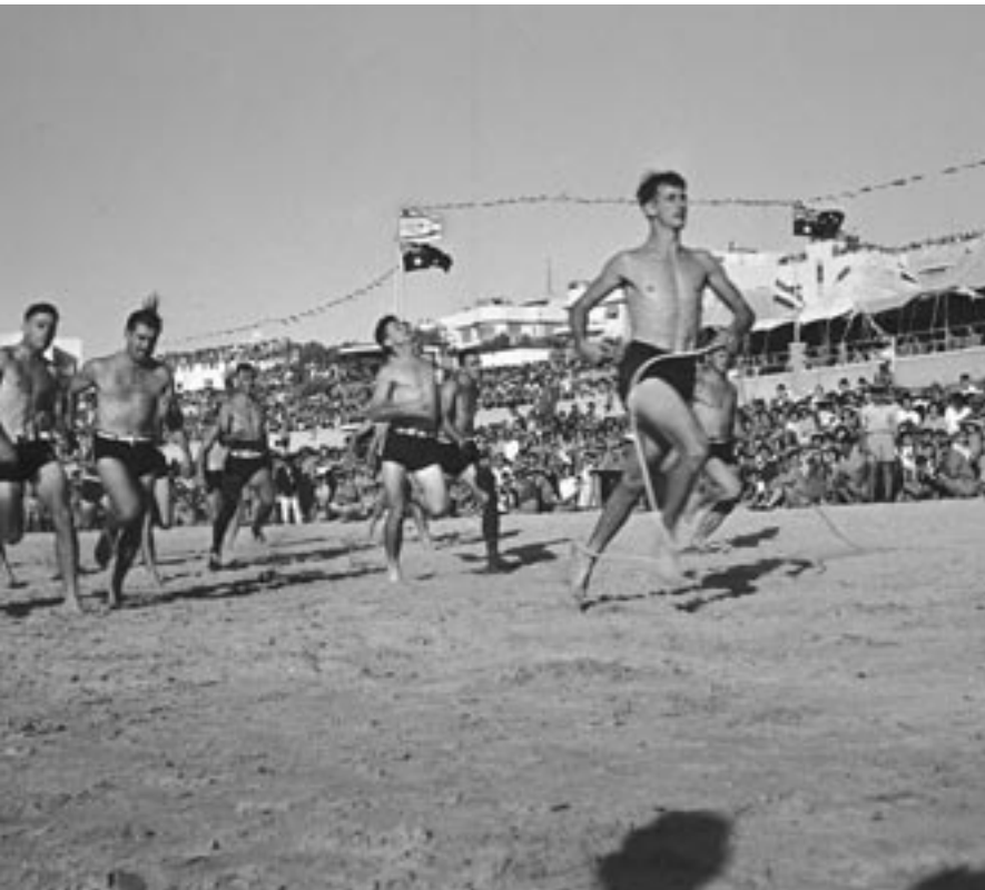
אוקטובר 1941. המונים מתאספים בחוף הים של תל אביב כדי לחזות בחיילי ה-AIF המשתתפים בפסטיבל הגלישה האוסטרלי. במקום מתנופפים הדגל האוסטרלי והדגל (לעיתיד) של מדינת ישראל.